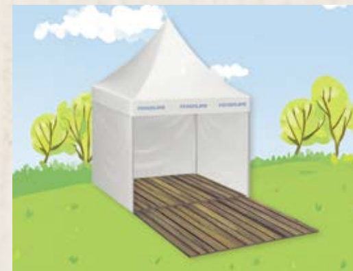
Terrassen-Pagode (mit 6 Tischgarnituren)